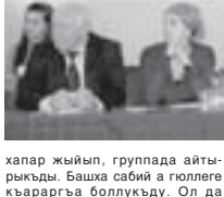
Билем берииуде... «Билем берииуде» закону жангы релакциясына көре, яслиде энчи энчи иелиде да болурга болуукту. Бу сферада да бизнес жетди.