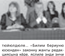
Билем берииуде... «Билем берииуде» закону жангы релакциясына көре, яслиде энчи энчи иелиде да болурга болуукту.