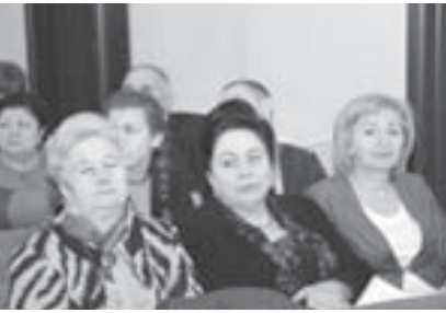
Жер-жердеде власть органдан себеплик излесек, аны да тапмайбыз.

«Бизни бөлүмюно оюночулары бла байламлыкларыбыз тап кыралыпдыла, алай власть органды бла артыкыда райончы бла шахарланы башчылары бла, арабыз осалды, деп тарагында профсоюз комитети башчысы. Биз иш берилүүнө бир бирлери бла халны созереге, социальный партнерлукну аныгтыруу хайырлы амалларын табар, профсоюз организацияла кыруу мурап бла урунуу коллективге бла тобашылу бардырырга корюшибиз. Алай ол предпрятягылы ишлери бизге каяжу сюепли тохтадыла».