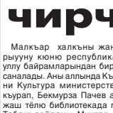
Малкыр халккы жангыруу кюноне