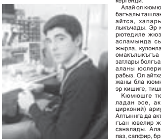
Аны ишин юсюндө айтканын таныгласан, андан аламын, кызырынлы, кёлю бля керуешир усталык жакыда. Алай итинуюлго, ахшы кёлю болган жаш адам анда уллу жетишимлеге жетери хакыды.

Аккызыланы Адемейни жашы Исса Биринчи Чегемде тууганды. КМКМУ-ну декоративно – прикладной факультетинде кюмош, алтын устага окуганды. Аны бошоганын жашын анда дерле бериге чаккыргандыла.