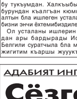
Алтындан ишенген омаккыла.