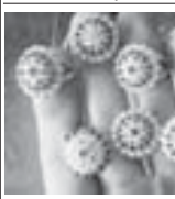
Багыталы ташлары бля сыргалача.