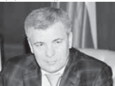
Аны себепли бу магъаналы бёлмонно айныуугъа биз энци эс бурбабиз, мындан ары да алай этерикбиз», - деп жагъанды КЪМР-ни Башчысы Теиттерде жыйлыу бошалгъанлай.