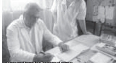
Цаколаны Тажир бля Додулары Сакинат.

Ташы – Таладача таза суу кеп элде болмас: жанында черек, шаданла. Алай бу проблема уа кемдей. Алтын суу элли тобонди кезилден келгечи. Аны иштели турганыны багырага санап, энди ол башындан табылырча этгенди.