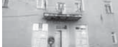
Эл клубха кирирге кыорыуулду.