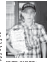
гомөтде жаруу этеди. Черек районну администрациясыны пресс-службасы.

чыктырманды. Рамазан америка халкыны араларында, экинчиле остетилини, ючюнчюно америка халкыны, төртюнчюно азербайджанлыны эм ахырында, финнала, белгыт хорлаткан молдовачы спортчула бла тобөшгөндү. Болсада бу жол ол андан кочуло, техникада итиркек болуп, биринчи жерини жибергенди. Аттасуу улу Бёююланы Исхакыда бла Агабийланы Ма-