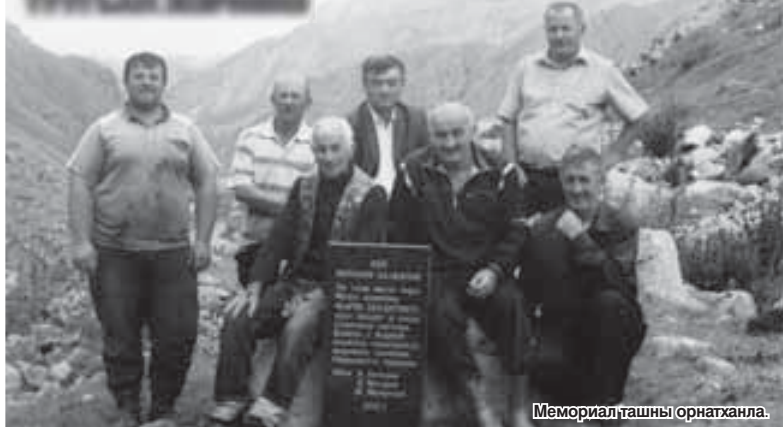
Мемориал ташны орнатханла.