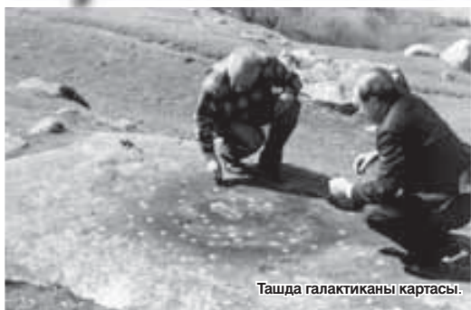
Ташда галактиканы картасы.

Малкър ауузунда ким болмагъанды? Анга суйюп ким кърамагъанды? Ары къонакъгъа келип, аны жашауу ахырына дери суйюп ким къоймагъанды? Мында болуп, Мухол тѣшюн кѣрюп, анга эс бурмагъанлай, бу былай некди деп, кеси кесинден сормагъан хазна табылсын.