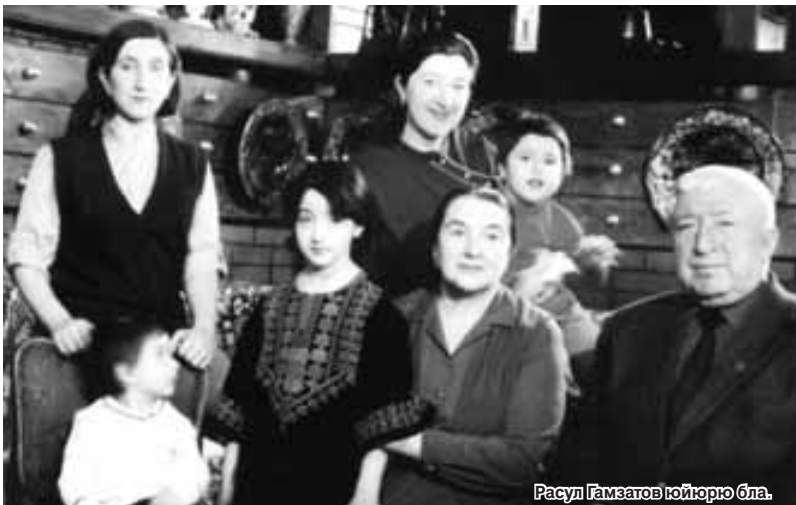
Расул Гамзатов юйторю бла.

Бек алгъа Расул Гамзатовну фахмусу окъуучула аны чыгъармаларын сойгенлерини сылтау. Аварлы поэте