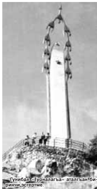
Гунибде «Зурналагъа» аталгъан биринчи эсертеме.

чамны бирге келишдире билгенинде хунерини энчилигин кёреме. Анга аны циклеринде - терттизгинлеринде бла жоралауларында - тюбейбиз. Биринчи назмуларында кёлюнден айтханы сезиледи, алада лирика, терен магъана, драма да барды, экинчиледе уа, эпиграммаладача, чам, оюн, жарыклыкъ да кеп. Поэтни фахмусуну бу жаны аны кесине да бек керекди, ол поэзиясын байыкъландырады, анга теренлик, жа-