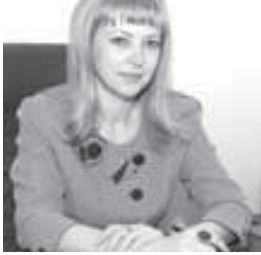
Бу огурлу усталык адамдан уллу тө-эмлюлюкю эм сабийлеге бла кесини ишине сөймекликни излейди. Юйрету-

Болсада Россияни Президенти В.Путин белгилегенча, «сабий садла»-ала бок мек-мамла, юйле тойлодоле, ала бок бирин-чиден, юйретуочилени коллективтериде эм ала ны гитчечиклеге кыайгырыуларды. Сабий садланы проблемаларыны юсоу бла ишлей, шай школга дери болган бериде урунганланы сошальны дара-жаларын көтөрүөгө тийишлиз.