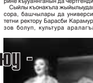
адан келген студентле, хычинледен ашар, айрандан ичин, заукълык ала тура эдиле. Бизни жаш тёлө бла корейле, бир бирлерин анылап, жарык халда аriu ушак бардыргандыла.

ден бирди. Шендого дуняда глобализация уллу жерни алады. Ол а бюгонолюкде хар адам да бийик биллили болурун излейди. Наслаха, университет анга да хазырды.