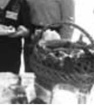
адан келген студентле, хычинледен ашар, айрандан ичин, заукълык ала тура эдиле. Бизни жаш тёлө бла корейле, бир бирлерин анылап, жарык халда аriu ушак бардыргандыла.