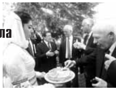
Къонакъла миллет малкъар культура арада.

Мен Отарланы Керимни атын журиютен Малкъар культура арга багъганымда. Юй Коре-