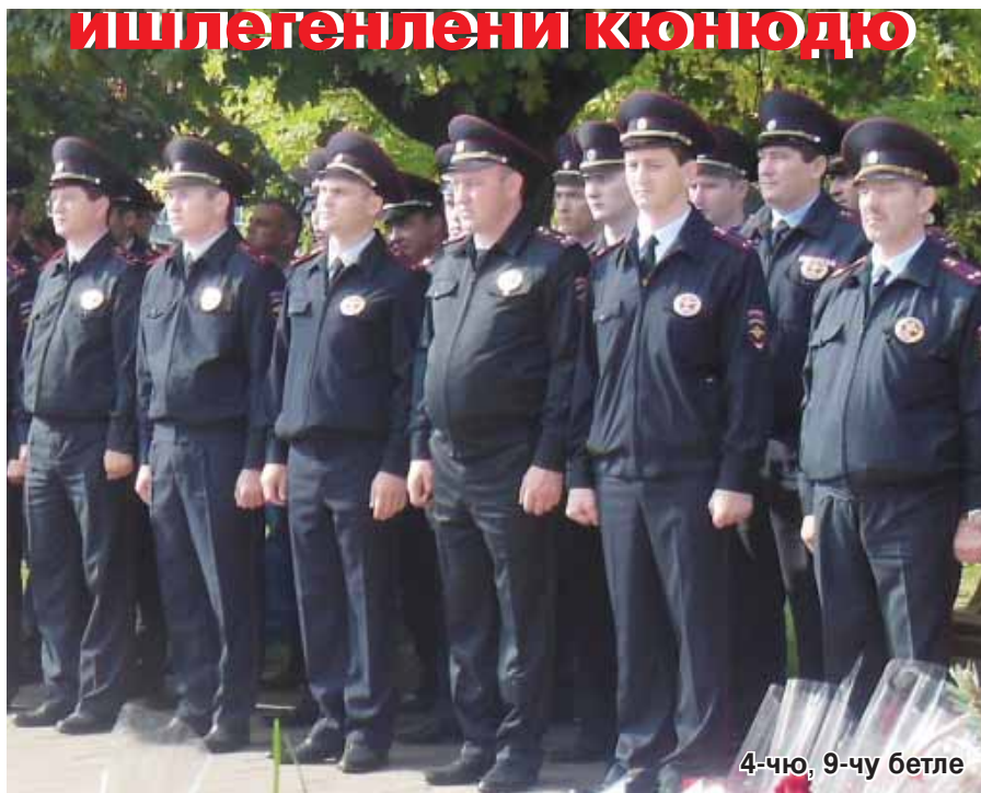
4-чу, 9-чу бетле