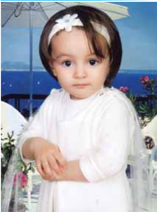
«Мен Бёзуланы Даринама. Бабугентде жашайма. Манга 2 жыл болады».