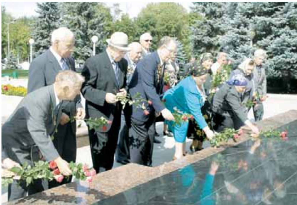
Ата журтну Жигитлерини кюнуне аталган материалла 4-чю эм 9-чу бетледе басмаланадыла.