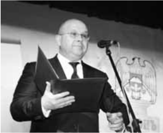
Ахыры. Аллы 1-чи бетдеди.

Ары дери уа 400-жыллыккыны майданында эсертмеге голле салуу болганды. Кырал концерт залда уа, байрамга аталып, уллу кермюч кыуралган эди.