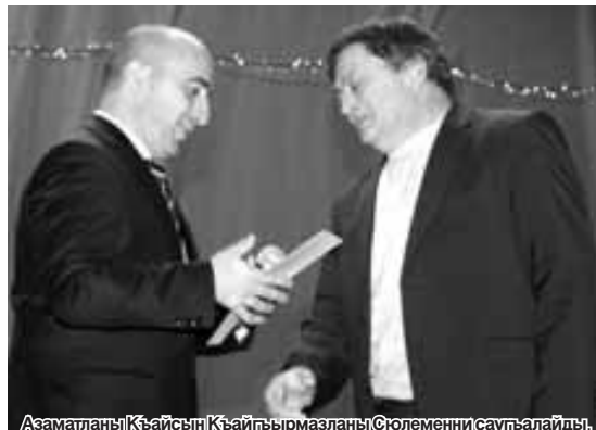
Азаматланы Кьайсын Кьайгырмазланы Сюлемени сауғалайды.

Арада постаметини юсюнде энди кеп кьалмай 3 метр бийиклиги болган аист сюеледи. Ол а, ауузу бла кьабып, арасында сабийкь олтурган кьол жауукьну сакь тутады. Скульптура ичинде темири болган пластикден ишленгенди, доммакь бетлиди.