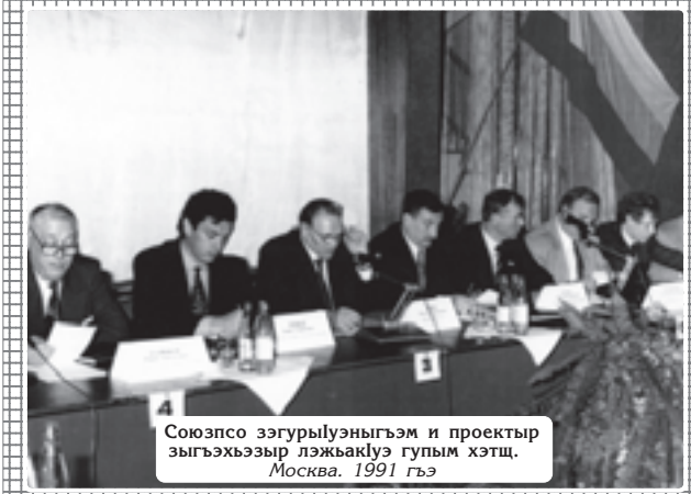
Союзпсо зэгурьлуэнынгъэм и проектыр зыгъэхъэр лажьакулэ гупым хэтщ. Москва, 1991 гъэ