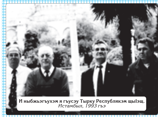
И ныбжьэгъухэм я гъусэу Тьрку Республикэм шьIэщ. Истамбыл, 1993 гъэ

Къыдэкыгъуэм ит тхыгъэхэр зыгъэхьэзырар Жыласэ Маритэщ.