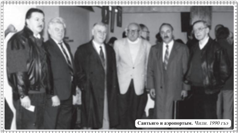
Сантьяго и аэропортм, Чили. 1990 гъэ