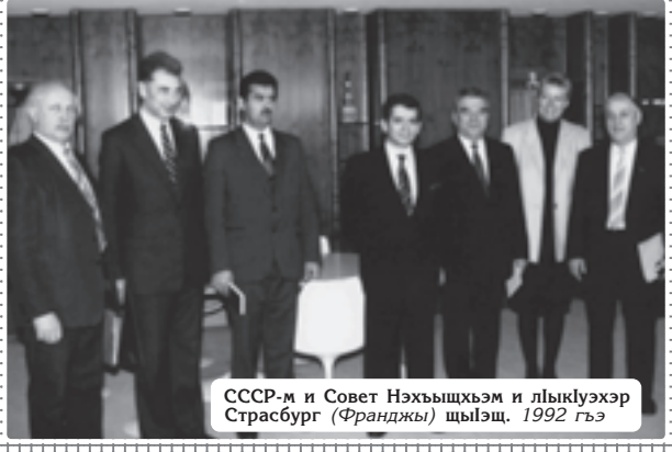
СССР-м и Совет Нэхъыщхьэм и лыкIуэхэр Страсбург (Франджы) щыцэ, 1992 гъэ

Зэманым къыгъэлъэгъуащ апухуэдэ цыхубэ гугъаплэхэм къэклэунэ зэрамыр. ИтIани СССР-м и Шыхубэ депутатхэм я езанэ сьездым мыхъэнэшхуэ илащ къэралыр демократие гуэгум тешэнымкIэ. Илъэс куэд лъандэрэ къымыкIуэуэ, къэрал псор кIэлъыплыу, абы щытепслэхыкхырт жылагуэр зыгъэпIейтхуэгуээхэм, зэпэщIуэнынгъэхэр, тIкIягъ