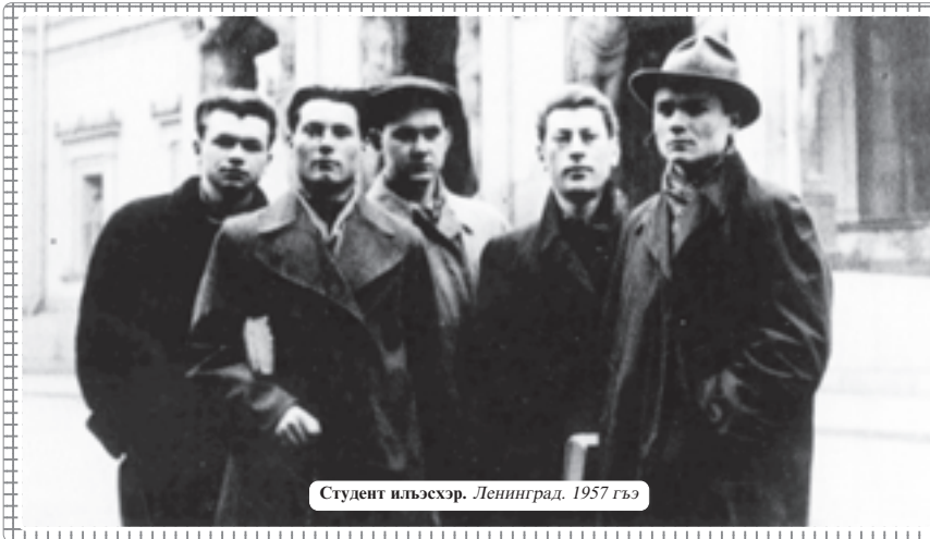
Студент пхьэхэр. Ленинград. 1957 гъэ

КЪАЛМЫКЪ ЮРЭ, СССР-м и цыхубэ депутат, Дунейпсо Адыгэ Хасэм и тхьэмадэ, 1991 гъэ