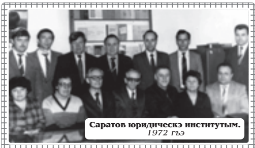
Саратов юридическэ институтым. 1972 гъэ