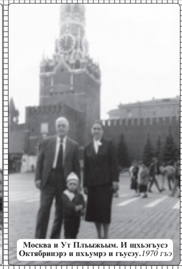
Москва и Ут Пльыжым. И шхыгъуэс Октябринэрэ и пхьумрэ и гүсүу. 1970 гъэ