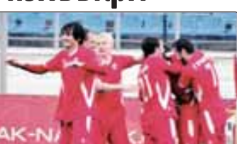
Текълунгъэм и дэржэгуэ.

«Спартак-Налшык» (Налшык) - «Таганрог» (Таганрог) - 3:0 (0:0). Налшык, «Спартак» стадион. Шэ-кълугъуэм и 9-м. Шыху 1100-рэ еплъыш.