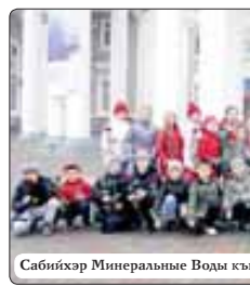
Сабийхэр Минеральные Воды кышпрэгъэблэгъэх.

ДУНЕЙСО фестивалыр Сочэ кылам шхукугъуэм 2-7 махуэ-хэм шхукугъуэ иккэ Урысейм, СНГ-м, Ватинем я къэралхэм я къа-фэлум гупнэр ахуэцхьыш. Ахуэ-дэ зыхьэ дэхэр кызырагъэп-щэцэ Москва къалэм и Правите-льствэм, къалышкым Шыналэ задалэжьыгъэхэм, дин Иухуэ-циплэхэм я энциплэныгъэмэр лъанкэ политикэмлэ и департа-ментым, Лъанкэхэм я уагуэ Москва адтам.