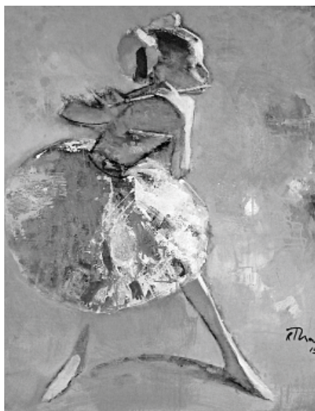
Р. Тураев. «Урок музыки»

• Мария БАЙСИЕВА.