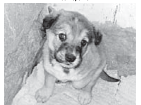
Сегодня мне подарили собачку. Правда, не знаю, какая порода, как воспитывать и т.д., у кого есть опыт, просьба поделиться