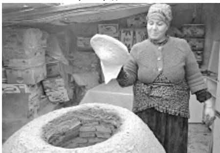
Тандыр. Долгожданный Тандыр. Теперь будем в теплицах есть горячие лавашы с самой! Вах!