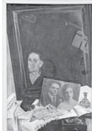
А.Б. Колкутин. «9 Мая»

В МУЗЕЕ ИЗОБРАЗИТЕЛЬНЫХ ИСКУССТВ Г. НАЛЬЧИКА ОТКРЫЛАСЬ ВЫСТАВКА, ПОСВЯЩЕННАЯ ВЕЛИКОЙ ПОБЕДЕ.