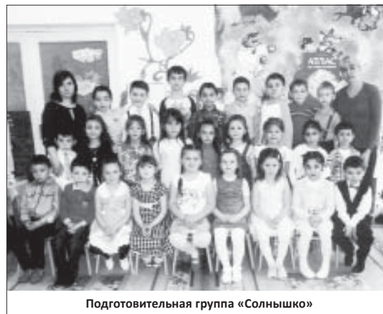
Подготовительная группа «Солнышко»