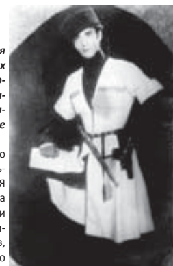
Анкара, 1973 г.

кать здесь оставшиеся артефакты, люди стали сами приносить мне их на продажу, я старался не отказывать никому, деньги на их покупку находились порой неожиданно. Бог помог мне всегда, потому что я занимался хорошим делом: очень не хочу, чтобы адыгские древности уходили за границу, переплывались или терлились.