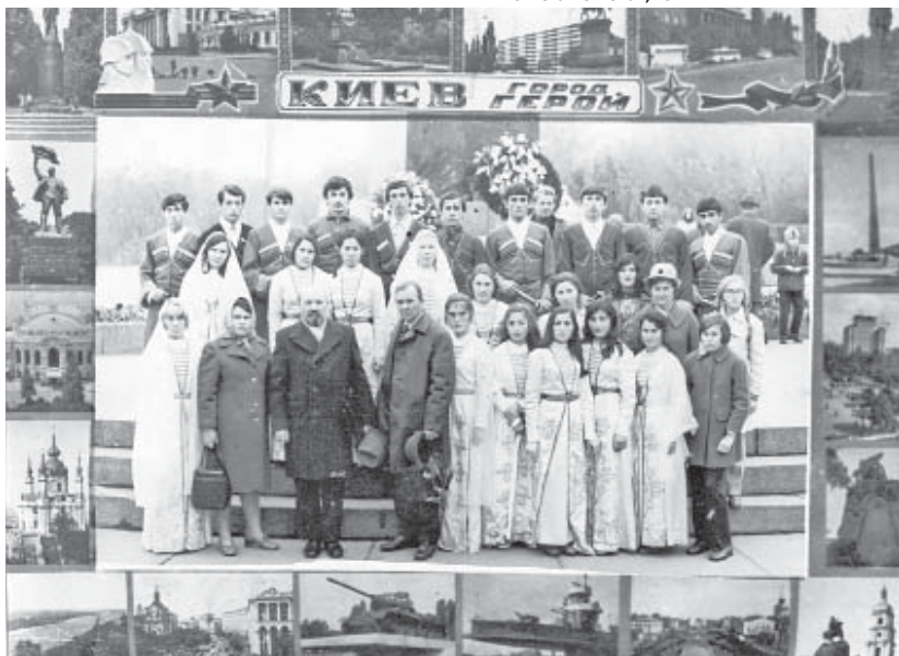
В парке Вечной Славы

поднялись в атаку и достигли окраины Звонкового. Первым в село ворвался боец-прохладянин ВОЛОДЕНКО. Увидев, что за угол сарая шмыгнул немецкий солдат, он побежал за ним. Но немца за сараем не оказалось. Володенко увидел колодезный сруб с опущенной в него цепью. Цепь была натянута и подрагивала. Заглянув в колодец, наш боец увидел голову фрица в зеленой пилотке. Наверное его вытащили втроем. Бледный и мокрый немец тут же рхнул на колени и залепетал по-своему: – Nicht shiesen! Nicht toten! Shonen Sie! (Не стреляйте! Не убивайте! Пощадите!).