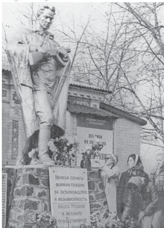
Юные краеведы возлагают цветы к памятнику на братской могиле с. Вета Почтовая, 1972 г.

23 ИЮНЯ 1941 ГОДА. ВТОРОЙ ДЕНЬ ВОЙНЫ. В КАБАРДИНО-БАЛКАРИИ, КАК И ВО ВСЕМ СССР, ОБЪЯВЛЕНА МОБИЛИЗАЦИЯ РЕЗЕРВИСТОВ. ЗАДАЧА: СРОЧНО ЗАКОНЧИТЬ ФОРМИРОВАНИЕ 175-Й СТРЕЛКОВОЙ ДИВИЗИИ, ЧАСТИ КОТОРОЙ НАХОДИЛИСЬ В ТО ВРЕМЯ ПОД ПРОХЛАДНЫМ. ПО РЕСПУБЛИКЕ ПРОКАТЫВАЕТСЯ ВОЛНА МИТИНГОВ, ВЫСТУПАЮТ РАБОТНИКИ ОБКОМОВ И РАЙКОМОВ, РАБОЧИЕ И КОЛХОЗНИКИ. ВСЕ ГОВОРЯТ О ВЕРОЛОМНОМ НАПАДЕНИИ ГЕРМАНИИ НА СОВЕТСКИЙ СОЮЗ. ОТЦЫ И МАТЕРИ ДАЮТ УХОДЯЩИМ НА ФРОНТ СОЛДАТАМ НАКАЗ БЕСПОЩАДНО ГРОМИТЬ ФАШИСТОВ.