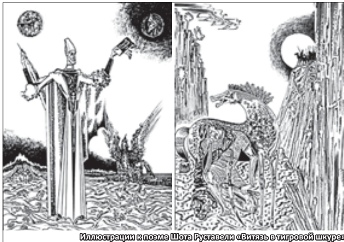
Иллюстрации к поэме Шота Руставели «Витязь в тигровой шкуре»