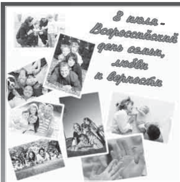
ДЕНЬ СЕМЬИ, ЛЮБВИ И ВЕРНОСТИ... ЧТО ДУМАЮТ ОБ ЭТОМ НАШИ ДЕТИ? СЕГОДНЯ МЫ ПРЕДОСТАВЛЯЕМ СЛОВО ИМ, ЧТОБЫ ОНИ РАССКАЗАЛИ О САМЫХ ЛЮБИМЫХ И ДОРОГИХ ЛЮДЯХ В ИХ ЖИЗНИ.

25 сентября 1974 года он запомнил на всю жизнь. В этот день Генеральный секретарь ЦК КПСС Л. И. БРЕЖНЕВ лично пожал руку неумолимому труженику и по-