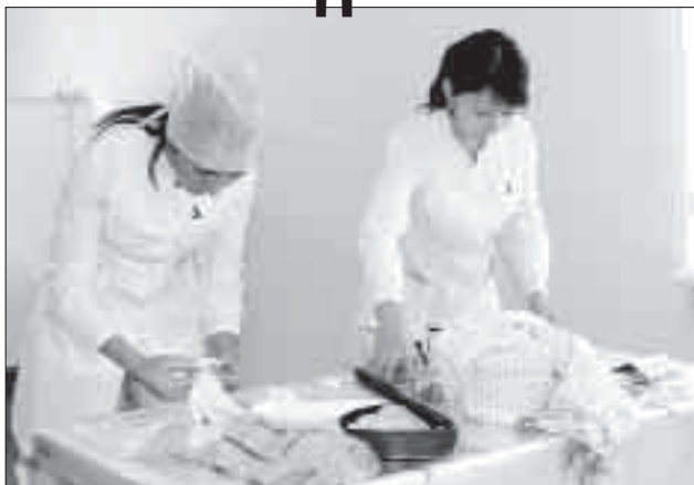
В КОНФЕРЕНЦ-ЗАЛЕ ГОРОДСКОЙ ПОЛИКЛИНИКИ №1 ПРОШЕЛ КОНКУРС «ЛУЧШАЯ МЕДИЦИНСКАЯ СЕСТРА-2014».