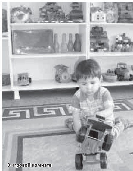
В игровой комнате

ГАЗЕТА «ГОРЯНКА» МНОГИЕ ГОДЫ СОТРУДНИЧАЕТ С ДОМОМ РЕБЕНКА. МЫ ПОМНИМ СТАРОЕ ЗДАНИЕ НА ЛЕРМОНТОВА, ГДЕ БЫЛО ТЕСНО, РАДОВАЛИСЬ ИХ ПЕРЕЕЗДУ В ПРОСТОРНОЕ НОВОЕ ЗДАНИЕ В ДУБКАХ. И ВОТ В ОЧЕРЕДНОЙ РАЗ ЕДЕМ В ДОМ, ГДЕ ЖИВУТ ОДИНОКИЕ ДЕТИ. «ОДИНОКИЕ СТАРИКИ», «ОДИНОКАЯ ЖЕНЩИНА», «ОДИНОКИЙ МУЖЧИНА» - ЭТИ СЛОВСОЧЕТАНИЯ ПРИВЫЧНЫ НАМ, НЕ РЕЖУТ СЛУХ, НО «ОДИНОКИЕ ДЕТИ»? ОДНАКО ОНИ ЕСТЬ. ИХ БЫЛО ОКОЛО ВОСЬМИДЕСЯТИ В ПОСЛЕДНИЕ ГОДЫ. СЕЙЧАС - 52. В ЧЕМ ПРИЧИНА ТАКОГО РЕЗКОГО УМЕНЬШЕНИЯ КОЛИЧЕСТВА МАЛЕНЬКИХ ЖИТЕЛЕЙ ЭТОГО БОЛЬШОГО ДОМА? ПО СЛОВАМ ИСПОЛНЯЮЩЕЙ ОБЯЗАННОСТИ ГЛАВНОГО ВРАЧА МАРИТЫ КРЫМКУОВОЙ, ПРОЦЕСС УСЫНОВЛЕНИЯ НАБИРАЕТ ОБОРОТЫ.