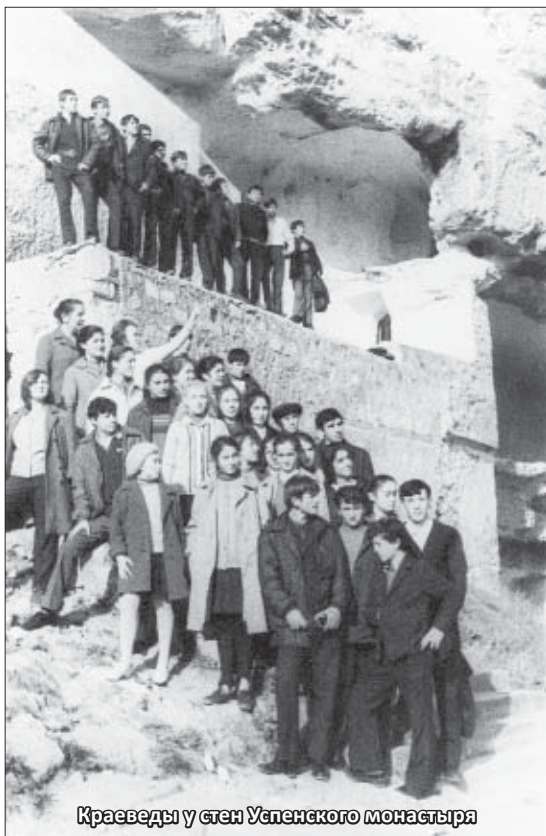
Краеведы у стен Успенского монастыря

О Великой Отечественной войне я знаю не понаслышке. Она сильно обожгла мое детство. Мне было 12 лет, когда в Нальчике я с серьезным обвинением попал в гестапо. Только счастливая случайность спасла: фашисты расстреляли всех, кто был в подвалах гестапо.