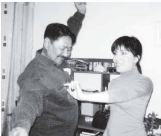
...встреча через двадцать лет поисков