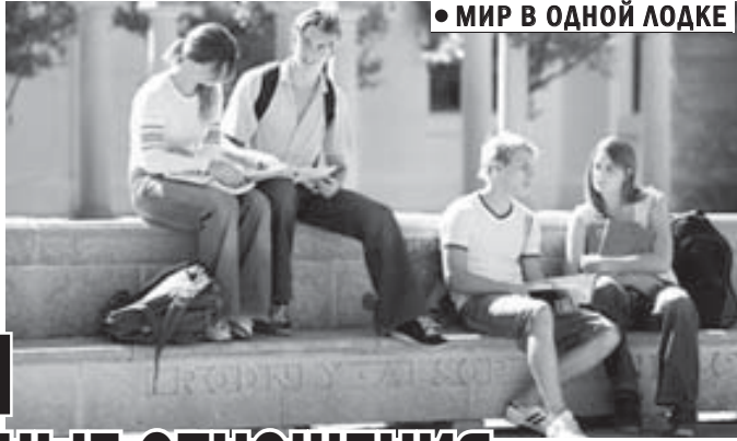
• МИР В ОДНОЙ ЛОДКЕ

Навыки готовить пищу, закупать продукты в магазине, заботиться о состоянии близкого тебе человека появляются только у пожилых людей, состоящих в браке, которым уже далеко за 50, когда они уже осознали необходимость стабильных отношений, взаимной поддержки друг друга, заботы о здоровье ближнего. На них приятно смотреть, они