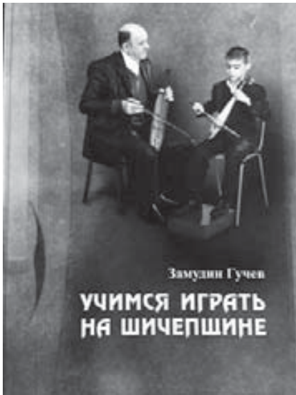
ЭТНОГРАФИЧЕСКИЙ ПРОЕКТ ORED RECORDINGS ПРИНИМАЕТ ЗАКАЗЫ НА КНИГУ ЗАМУДИНА ГУЧЕВА «УЧИМСЯ ИГРАТЬ НА ШИЧЕПШИНЕ» + DVD ПРИЛОЖЕНИЕ.

Издание содержит ценнейшую информацию о технике игры на традиционном адыгском музыкальном инструменте. Замудин ГУЧЕВ собрал воедино, систематизировал и описал доступным языком все сведения, наблюдения и опыт, которые получил в процессе многолетнего погружения в черкесскую музыкальную культуру. Это первый масштабный труд, посвященный традиционной двухструнной шичепшине.