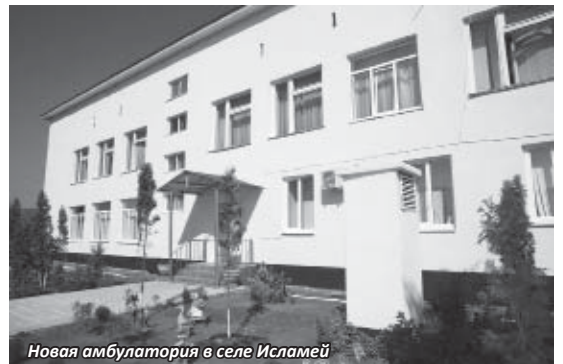
Новая амбулатория в селе Исламей

Кабардино-Балкария, РАН и МГУ подписали трехстороннее соглашение о сотрудничестве. Оно предусматривает совместные научно-исследовательские работы, программы обмена учеными, преподавателями и аспирантами, создание совместных научно-исследовательских и инновационных структур, организацию международных и всероссийских на-