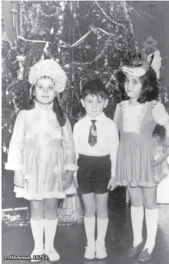
г. Нальчик, 1975 г.

Речь пойдет, конечно же, не о парижской молодости Эрнеста ХЕМИНГУЭЯ, а о том, как встречали Новый год большинство моих ровесников лет этак 35 назад. В те далекие теплые годы ваш покорный слуга ( на снимке ), как и миллионы советских детей, искренне радовался приходу волшебного праздника, снегу, елке и началу зимних каникул. Известно, что любому празднику, а тем более такому, как встреча Нового года, предшествует его томительное ожидание. Пока мы, дети, «томимся», взрослые занимались приготовлениями. Одним из знаков приближающегося праздника были визиты наших сельских тетюшек. Туго упакованные в добротные пальто, с головами, покрытыми распространенными в то время бурными шерстяны-