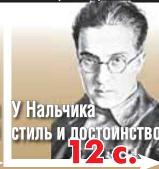
У Нальчика стиль и достоинство