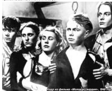
Кадр из фильма «Молодая гвардия», 1948 год.