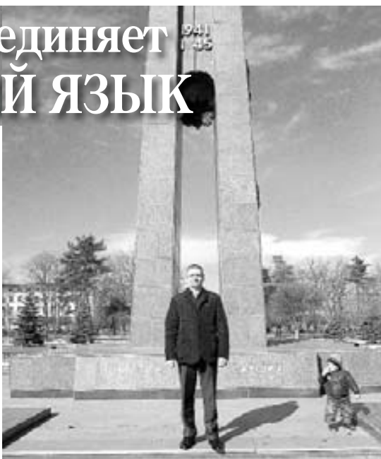
У памятника нальчанам, павшим в годы Великой Отечественной войны

Встретил я здесь и односельчанину, который прежде жил и работал в Тырныаузе, а теперь живёт в Нальчике и отдыхает в другом санатории. Мир тесен, Кавказ на самом деле мал, и все мы, живущие в этом реги-