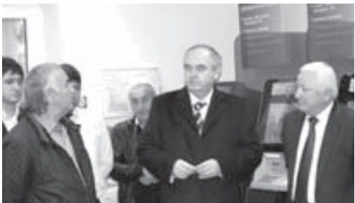
В Управлении Федеральной службы судебных приставов России по КБР прошло заседание Общественного совета, на котором в режиме видеоконференции обсудили итоги работы за нынешний год.