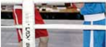
Материалы рубрики подготовили Альберт ДЫШЕКОВ и Анатолий ПЕТРОВ