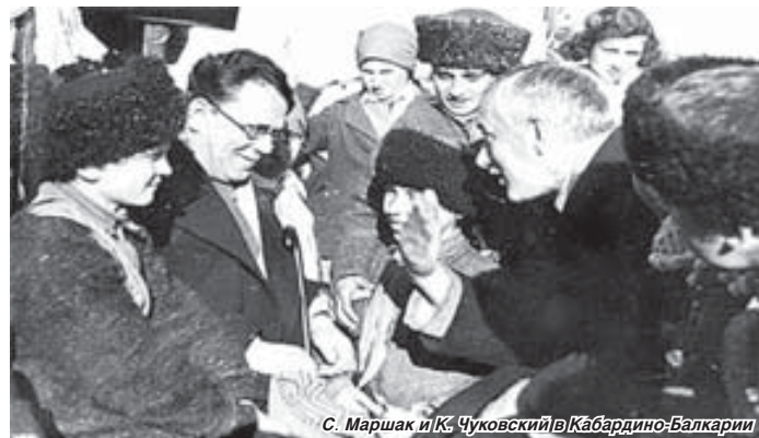
С. Маршак и К. Чуковский в Кабардино-Балкарии

Такое выступление главного советского педагога фактически означало запрет на профессию. В среде тогдашних критиков