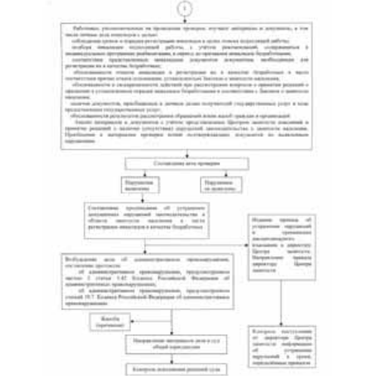
Утвержден приказом Госкомзанятости КБР от 15 апреля 2014 г. №42-П АДМИНИСТРАТИВНЫЙ РЕГЛАМЕНТ ПРЕДОСТАВЛЕНИЯ ГОСУДАРСТВЕННОЙ УСЛУГИ ПО ОРГАНИЗАЦИИ ПРОФЕССИОНАЛЬНОЙ ОРИЕНТАЦИИ ГРАЖДАН В ЦЕЛЯХ ВЫБОРА СФЕРЫ ДЕЯТЕЛЬНОСТИ (ПРОФЕССИИ), ТРУДОУСТРОЙСТВА, ПРОХОЖДЕНИЯ ПРОФЕССИОНАЛЬНОГО ОБУЧЕНИЯ И ПОЛУЧЕНИЯ ДОПОЛНИТЕЛЬНОГО ПРОФЕССИОНАЛЬНОГО ОБРАЗОВАНИЯ