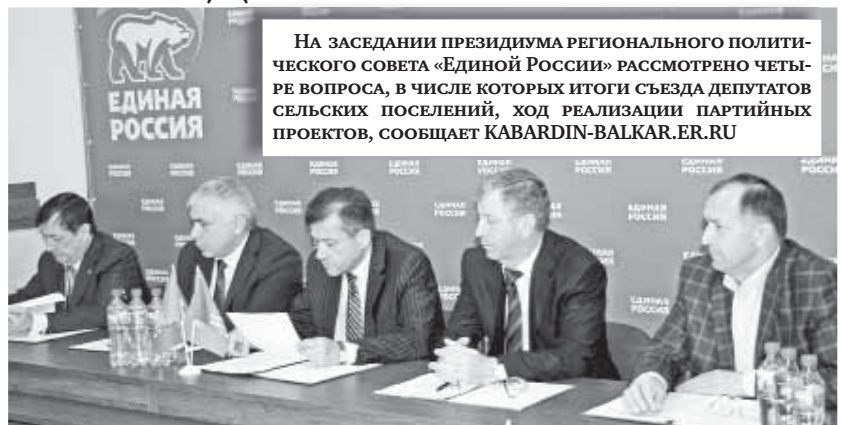
На заседании Президиума регионального политического совета «Единой России» рассмотрено четыре вопроса, в числе которых итоги съезда депутатов сельских поселений, ход реализации партийных проектов, сообщает KABARDIN-BALKAR.ER.RU