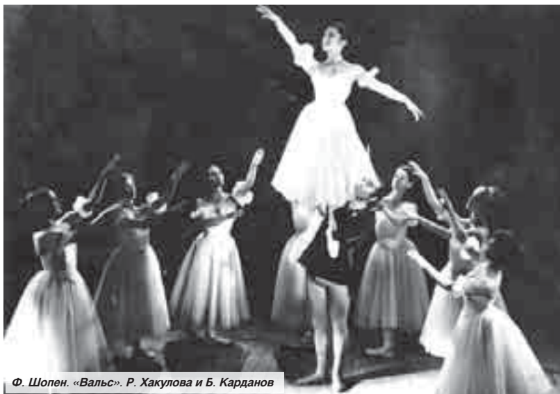
Ф. Шопен. «Вальс». Р. Хакулова и Б. Карданов