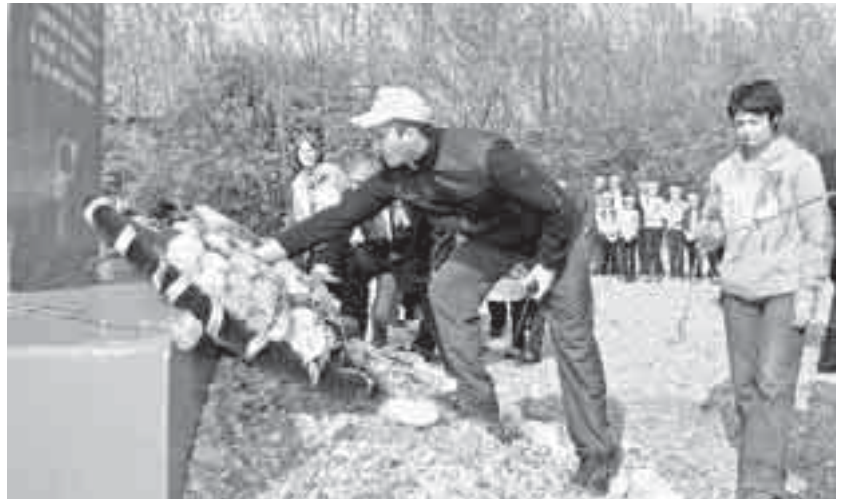
Возложение венков к памятнику воинов 2-й гвардейской стрелковой дивизии 37-й армии, погибших в п. Кашхатау в 1942 г.

На Высоте 910, где сражались воины 37-й армии, нас ждала тишина. Здесь осенью 1942 года