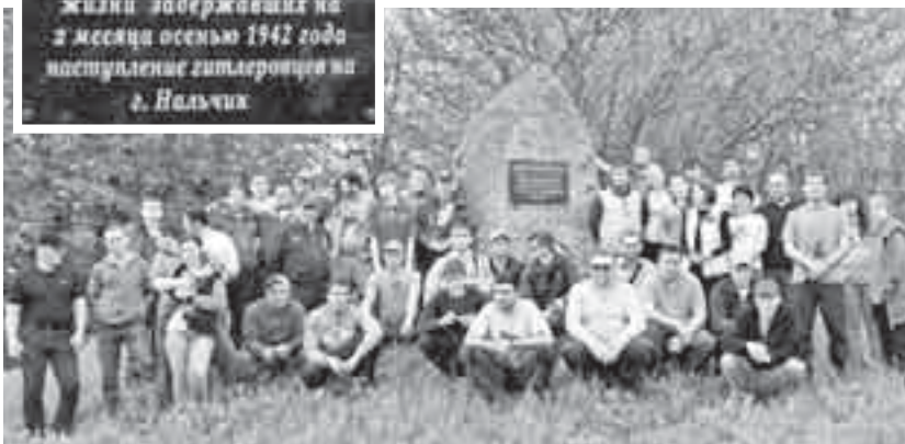
Высота 910 – мемориальная плита воинам 37-й армии, погибшим в 1942 г.

войной, здесь нет ни одного нетронутого сантиметра земли. Она с десяток раз переходила из рук в руки в отчаянной попытке отвоевать этот кусок земли. На зелёном холме, растворяясь в небе, стоит высокая белая арка. Памятник солдатам полуразрушен, в своё время с него сорвали железные цепи, унесли бросающиеся в глаза художественные элементы. Монумент выдержит многое и сегодня упрямо держится каменными ногами за землю, сохраняя каждой своей молекулой священную память о тех кровавых событиях. Невольно представляешь, как ускоренно прокручивается плёнка жизни, садится и встаёт солнце, идёт бой, за ним – тишина и снова бой. Несколько шагов и попадаешь в лес, раны которого заросли высокой травой. Несколько шагов