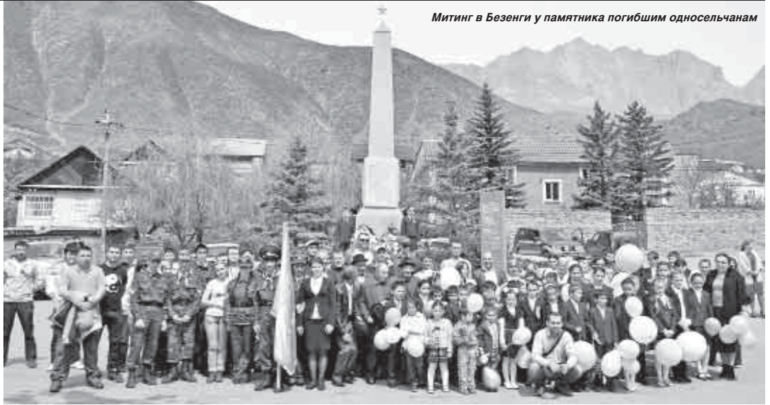
Митинг в Безенги у памятника погибшим односельчанам