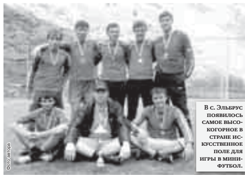
В с. Эльгерус появилось самое высокогорное в стране искусственное поле для игры в мини-футбол.

К этому событию был приурочен турнир, в котором победу праздновала «молодёжка» из Тырнауза. Второе и третье места заняли первая и вторая команды Нейтрини.