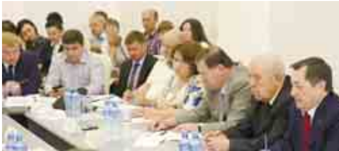
контроль за вливанием этих денежных средств туда, куда они были предназначены».