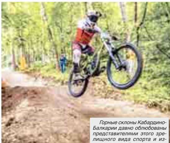
Горные склоны Кабардино-Балкарии давно облюбованы представителями этого зрелищного вида спорта и известны во всей стране.