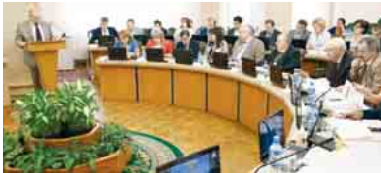
Пресс-служба врио Главы и Правительства КБР