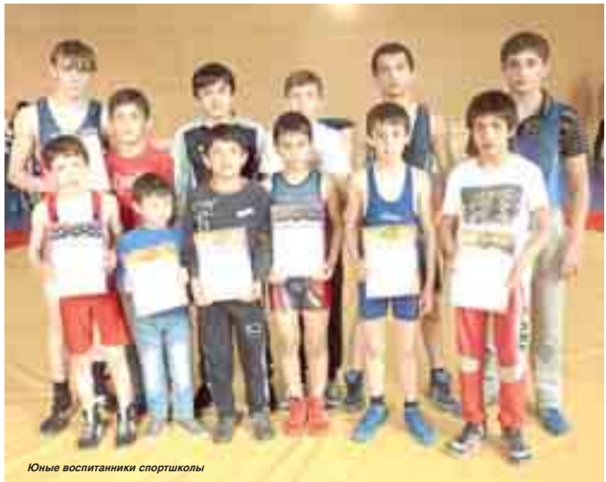
Юные воспитанники спортшколы