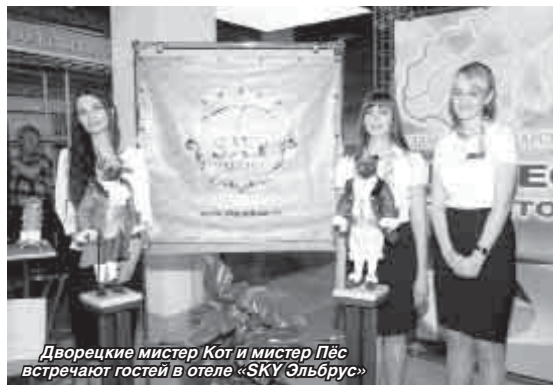
Дворецки мистер Кот и мистер Пёс встречают гостей в отеле «SKY Эльбрус»

выпуск вишневого и кизилового компотов. Банки оформили в стиле домашних заготовок. Прохладненский хлебозавод представил на конкурс хлеб «Бабушкин», каравай «Праздничный», заварные кокосовые пряники и радужные кексы. Как рассказали работники, у них выпускается довольно обширный ассортимент товаров. Есть хлеб социальный, но есть и дорогой. Продукция, несмотря на столь широкий выбор, не залеживается на полках.