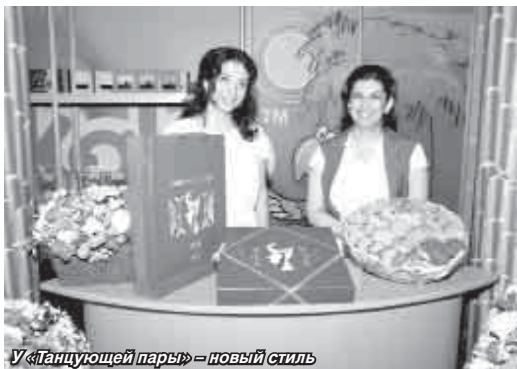
У «Танцующей пары» – новый стиль

Традиционный конкурс продукции предприятий, представленной на конкурс «100 лучших товаров России» и на соискание премии Главы КБР в области качества, проходит в нашей республике каждый год. Вчера в экспозиционном зале бизнес-инкубатора конкурсная комиссия по качеству ознакомилась с товарами, услугами, предприятиями, номинирующимися на звание лауреата.