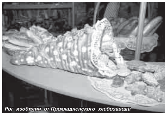
Рог изобилия от Прохладненского хлебозавода

Традиционный конкурс продукции предприятий, представленной на конкурс «100 лучших товаров России» и на соискание премии Главы КБР в области качества, проходит в нашей республике каждый год. Вчера в экспозиционном зале бизнес-инкубатора конкурсная комиссия по качеству ознакомилась с товарами, услугами, предприятиями, номинирующимися на звание лауреата.