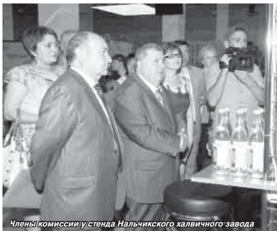
Члены комиссии у стенда Нальчикского халвичного завода

Конкурс проводится в следующих номинациях: продукция производственно-технического назначения; промышленные товары для населения; продовольственные товары; изделия народных художественных промыслов; услуги для населения; услуги производственно-техни-