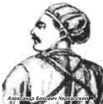
Александр Бекевич Черкасский

сячных жалований. В кругу своих соотечественников, изъявивших желание служить русскому царю, Георг Лермонт пользовался авторитетом. В 1617 году, минуя должности писаря и пятидесятника, он назначается с одобрения роты прапорщиком, а в декабре 1618 года – поручиком.