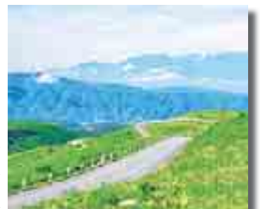
Гити реализация плана по приведению в нормативное состояние федеральной трассы планируют подвести на заседании Правительства КБР десятого августа. Ирина ШКЕЖЕВА Фото Камала Толгурова

по приведению в нормативное состояние федеральной трассы планируют подвести на заседании Правительства КБР десятого августа. Ирина ШКЕЖЕВА Фото Камала Толгурова