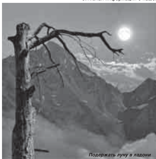
Подержать луну в ладони

На данный момент я сделал фото почти всех птиц Кабардино-Балкарии, а их около 150 видов. Хочу организовать выставку после того, как завершу этот проект. Есть задумка о выпуске фотоальбома. А пока выкладываю кое-что на своей странице в Яндексе. У нальчикского фотоклуба «Свой стиль» есть собственный сайт fotobworld.ru . Для нас важно, чтобы посредством глобальной сети шире распространялась позитивная информация о нашей