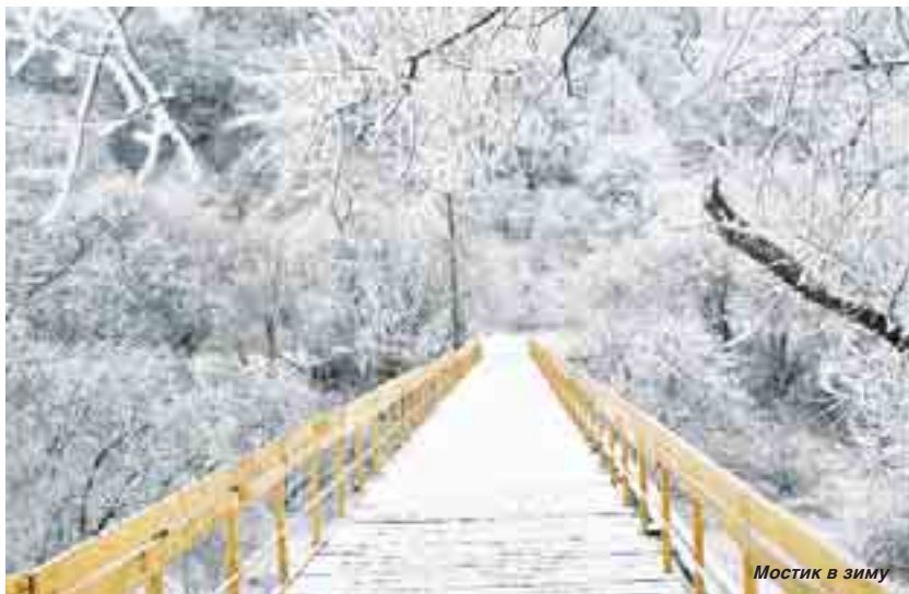
Мостик в зиму

птиц, обитающих на территории республики, но они далеко не полные.