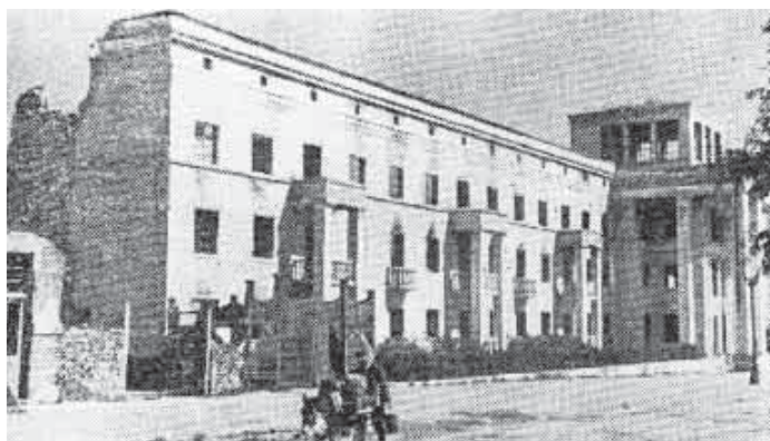
Разрушенное фашистами здание гостиницы «турист» (турбаза Нальчик) 1943 г.

пересечении улиц Шогенцукова и Лермонтова находится одно из подразделений Министерства внутренних дел КБР. Но старжили до