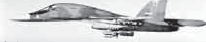
Отрабатывается прицельная система бомбометания в горных условиях

В 1934 году к подножию Эльбурса проложили дороги, что дало возможность поднять на высоту тяжёлую научную аппаратуру. С этого момента здесь стали проводиться исследования по актинометрии и атмосферной оптике, физике облаков и осадков, атмосферному электричеству и космическим лучам, физике снега и льда, высокогорной биологии и медицине. Так начала свою деятельность Эльбурская научная экспедиция (впоследствии преобразованная в Высокогорный геофизический институт), ставшая площадкой для многих серьёзных открытий, имевших мировое значение.