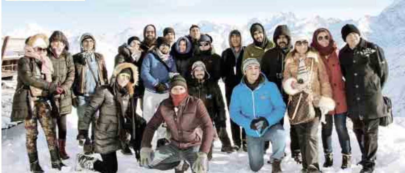
Участники фестиваля «Танцы над Эльбрусом» – поездка по районам Кабардино-Балкарии.