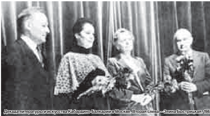
Декада литературы и искусства Кабардино-Балкарии в Москве. Вторая слева – Элина Быстрицкая, 1988