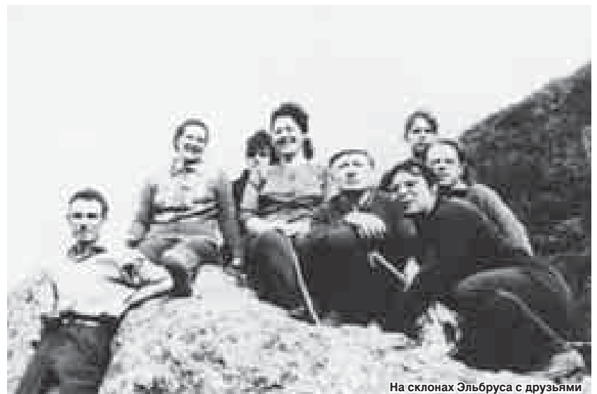
На склонах Эльбруса с друзьями

Ансамбль «Кабардинка» в годы его деятельности – это одна из серьёзных забот министра. Много сил отдаёт Эфендиев развитию и становлению в республике кабардино-балкарского сценического искусства. Успехов добивается он, хodayтайству перед союзным мини-