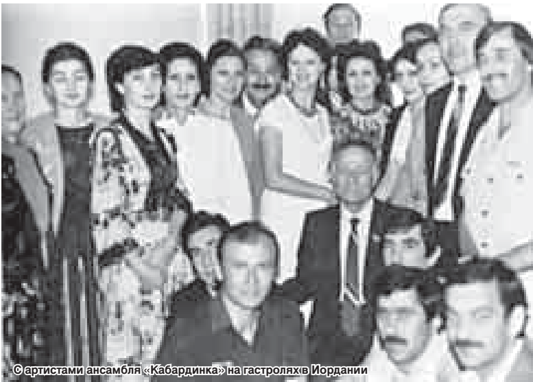
© артистами ансамбля «Кабардинка» на гастролях в Иордании