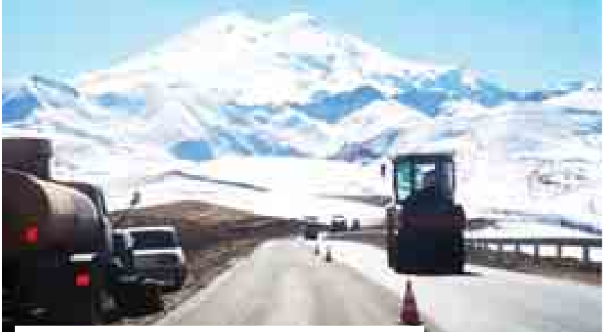
В Кабардино-Балкарии завершается строительство автодороги Кисловодск – Долина нарзанов – Джилы-Су – Эльбурс, на которую по ФЦП «Юг России» выделено более двух миллиардов рублей.