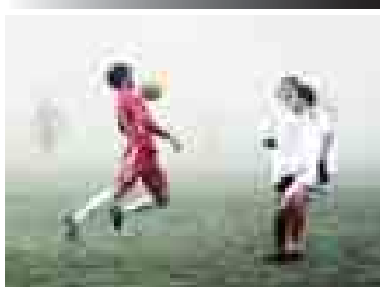
Первенство ПФЛ, зона «Ю», вторая группа. Положение на 24 ноября

Первая игра с «Машуком», обернувшаяся поражением красно-белых, выглядела скорее как неприятная случайность. Шедший на последнем месте клуб из Пятигорска не представлял собой угрозы, но питогчане повели в немалой степени благодаря усилиям воспитанников «Спартак-Нальчик».