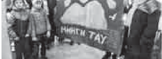
Подарок гостей – войлочный ковёр с изображением Эльбруса