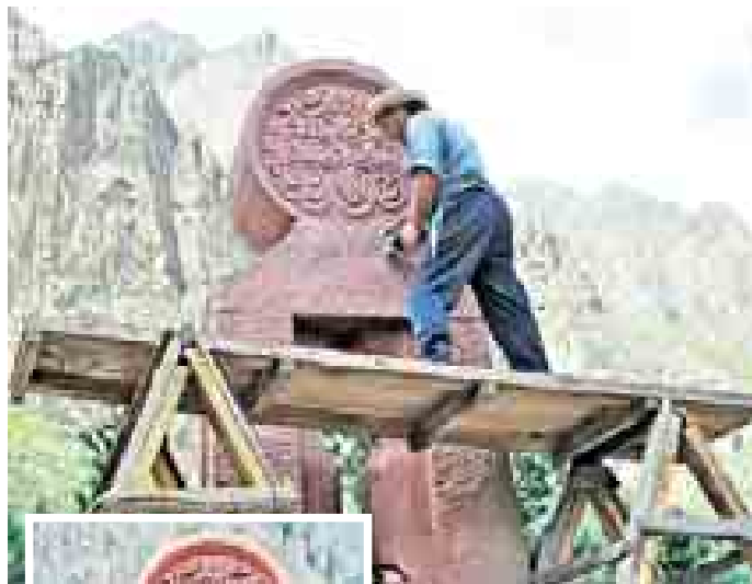
Авторская доводка после установки памятника в с. Булунгу Чегемского района КБР, 2008 г.

Потом открыла странную книгу, которая, по определению автора, являлась «синтезом графики и слова, сохранившего описательное начало». В основе – его каллиграммы и инсталляции. Озадачилась: книга ли это в привычном для нас понимании? Книга! О чём или о ком? О нём самом, Горлове – о разбеге, о полёте, о парении: «Я буду распят небом. Я уже ощущаю, как, проникая в поры, небо во мне вскипает!» В перекрёстьях слов, в перекрёстьях текстов, мыслей и чувств – монолог, внутреннее «Я» художника, поэта, человека. Но, даже во всеуслышание признаваясь: «...Я грешник, для которого церковь нет; Я горячка мыслей и спячка чувств; Я немощная мощь, я низкая высота...». Горлов не выворачивает себя наизнанку, не позволяет лицезреть глубины своей души. Кому интереснее – тот многое увидит и услышит. Увидит в его книжной графике, картинах, рисунках, скульптурах, инсталляциях, рельефах, которых, попросту говоря, не перечесть. Услышит в бении неспокойного сердца, которое