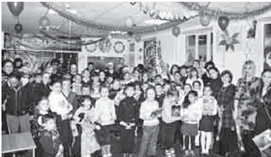
«Баксанский», библиотеки с. Дыгулыбгей. В уютном и красочно оформленном зале собрались более 40 детей и подростков с ограниченными возможностями здоровья. Праздник получился насыщенным и интересным. Преподаватели и учащиеся детской школы искусств с. Дыгулыбгей

Она открылась в Международный день инвалидов в многофункциональном молодёжном центре «Галактика» при поддержке администраций Баксана и с. Дыгулыбгей, комиссии по делам несовершеннолетних и защите их прав, местного отделения «Единой России», Всероссийского общества инвалидов, департамента образования, МО МВД РФ