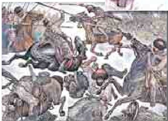
Иллюстрации к серии «Черкесика», 2014 г.

ли эта моя работа?.. Прав он, конечно, прав!»