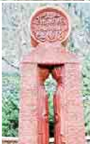
Памятник односельчанам, погибшим в годы Великой Отечественной войны 1941-1945 гг. в с. Булунгу, 2006-2008 гг.

отдаётся ритмом его стиха. Это у него – художника! – стал девизом слоган «Ни дня без строчки», это о нём, а не о себе сказал Маяковский: «...Изводишь единого слова ради / Тысячи тонн словесной руды. Но как испепеляюще слов этих жжение / Рядом с тлением слова-сырца!»