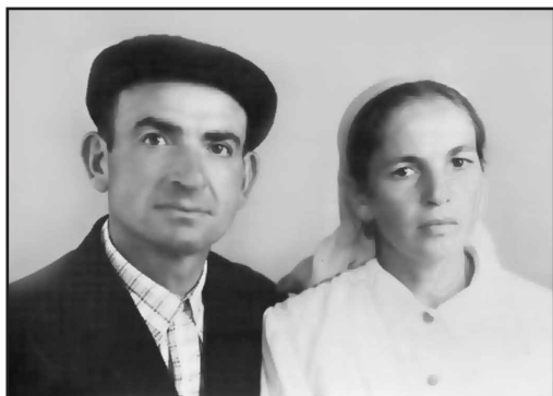
Додулары Шыйыхны жашы Таулан юй бийчеси Сюйдюмланы Азиза бла

Додулары Шыйыхны жашы Таулан 1927 жылда Шыккыда тууганды, Къзахстанны Талды-Курган областыны Каратальский районуну Тельман атлы колхозуна кёчюрюгенди.