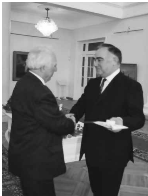
Къабарты-Малкъар Республиканы президенти В. М. Коков Мокъаланы Магометге КъМР-ни Къырал саугъасын берген кезиу. 2000 ж.