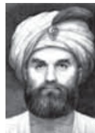
Мысырым и султIан Алий-бек ал-Кэбир (1728–1773)