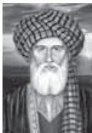
Мысыр тхыдэтх щэджащэ Ийас Мухъэмэд (1448–1524)