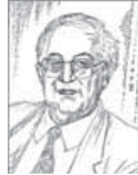
Хьэрып тхаклэуэ цлэрылэуэ Юсеф ас-Сибани (1917–1978)