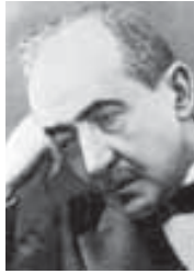
Хьэрып усаклэуэхэм я пащтыхь Шэужкый Ахьмэд (1870–1932)