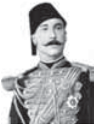
Хьэрып литературэм и неоклассик Нэурзокъуэ Мыхьмуд (1838–1904)

флэлыкі нэхъ ин дыдэ шызиіэхэм ящыщым, и гуащлэр зэрызэфлэувам Теймур Айшэ и фыщлэшхуи хэлъщ. 1925 гъэм тхыгъэ шхъэхуэ абы хуитхауэ шытащ и адыгэ егъэджаклэуэм.