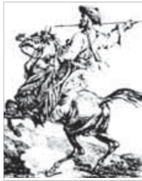
Мамлюк шуей зауэлIхэр

Бжыпэр яубыда нэужь, тырку мамлюкхэм хъэмшэрийхэр лъэныкьуэ ирагъэз икIи кьэралым и тепщэхэм яхохъэ. Илъэси 130-кIэ зыми я блыгу ахэр щIэтакъым. А зэманым кьриубыдэу Iэтащхъэу мамлюк 25-рэ зэблахъуащ, абыхэм яхэтащ адыгэхэри.