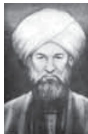
Мысыр щIэныгъэлI, тхакIуэ цIэрыIуэ ал-Махъдиси Iэбу-Хъэлид (1416–1483)