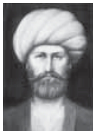
Мысырымрэ Сириемрэ я султIан Джэмболэт Ашрэф (1500–1501 гъгъ. – тепщэу щыщыта илгъэсхэр)