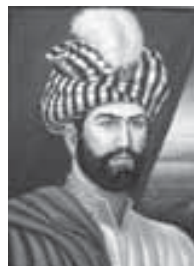
Мысырымрэ Сириемрэ я султIан Мухъэмэд (Къэрмохъуэ) Сейфеддин (1412–1421 гъгъ. – тепщэу щыщыта илгъэсхэр)

А лъэхъэнэхэм Мысырым щыпсэуа адыгэхэм, фыуэ ялъагъу я хэкум сыт хуэдизкIэ пэмылэщIэми, я лъэпкъ напэр ягъэпудахъым – щэнхабзэкIэ, щIэныгъэрэ литературэкIэ, зауэ хуэлухуэщIэрэ къэрал зехъэнкIэ зэфIэкишхуэ яIэу зыкыщагъэлъэгъуа къэралым, хэку етIуанэ яхуэхъуам, и пщIэр лъагъу яIэту, хуэлэжу кыулыкъу хуащIащ.