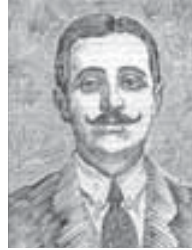
Хьэрып литературэм и классик Теймур Мыхьмуд (1894–1973)