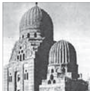
Мамлюкхэм я мавзолейр