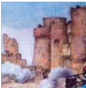
Мамлюкхэр щызэтраукIа быдапIэр

МахуипIэ нэхъ дэмыкIыу, Наполеон Каир дохъэ икIи езым и тепщэныгъэ абы щегъэуэв. Ал-Джэбэрти щыхъэт зэрытехъуэмкIэ, кыIщIедзэ «зауэшхуэхэм, щхъэфэцыр зыгъэхъей къэхъукъащIэхэм, насыпыншагъэ шынагъуэхэм, хъэзаб шэчыным, къехуэкIыным, зэхэзэрыхьам, залымыгъэм, зэкIэлъымыкIуагъэм, зэхэкъутэныгъэм, кIэщIу жыпIэмэ зэхъуэкIыныгъэ инхэм» я лъэхъэнэм.