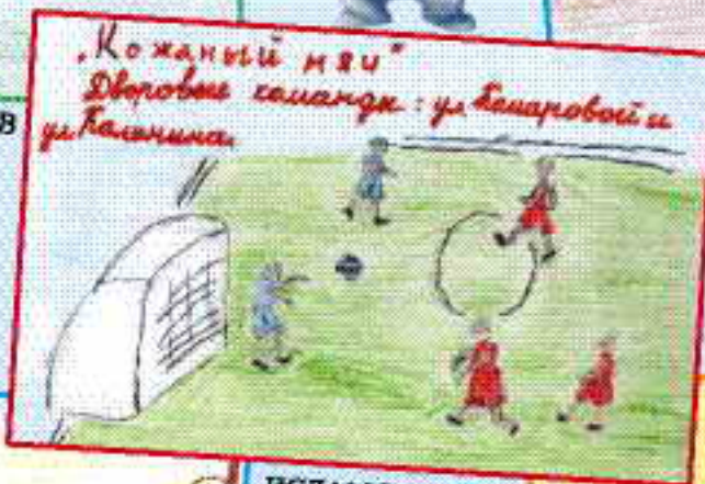
„Кожаный мяч“ Дворовые саландж: ул. Баксановской и ул. Башинина