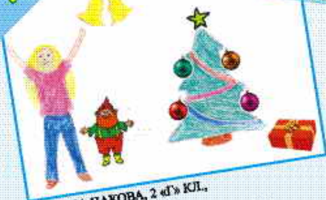
АМИНА НАКОВА, 2 «Г» кл., СОШ № 9, г. НАЛЬЧИК. С ГОДОМ ЛОШАДИ!